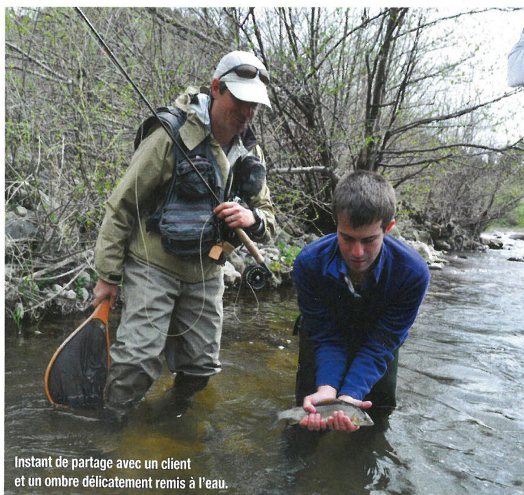
Instant de partage avec un client et un ombre délicatement remis à l'eau.